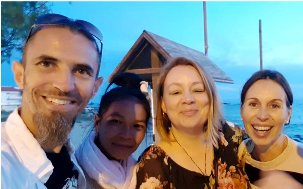
YOGA FÜR FRAUEN TEAM MALLORCA: YOGA, KOCHEN, MASSAGE